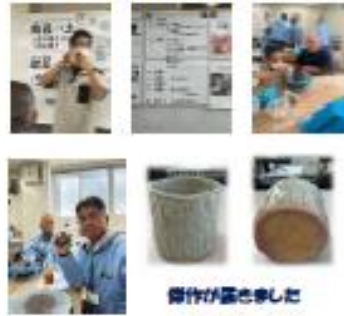
器作りが楽しかった