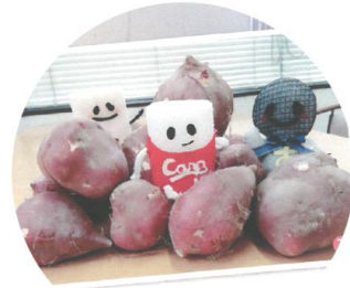
名物キャラクター 「フィルター君」