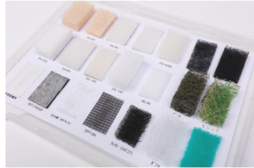
フィルタ サンプル